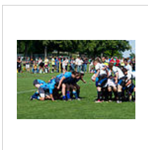
Préparation de la mêlée