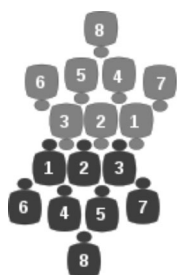
Disposition d'une mêlée

Au rugby à XV, la mêlée est une phase de jeu qui sanctionne une faute mineure ou un arrêt de jeu.