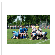
Mise en place de la mêlée

La sortie du ballon, généralement récupéré par le demi de mêlée ou le n o 8, met fin au regroupement. Le demi de mêlée défenseur a le droit de suivre la progression du ballon, afin d'exercer une pression défensive ou psychologique.