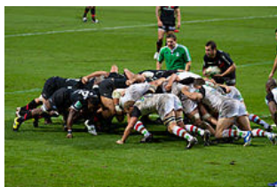
Le demi de mêlée prêt à introduire la balle dans une mêlée.

La mêlée se forme à l'endroit de la faute (généralement les en-avants) ou de l'arrêt de jeu, ou aussi près que possible de ce point dans le champ de jeu. En cas de faute ou d'arrêt de jeu dans un en-but, la mêlée se forme à 5 mètres de la ligne de but. En cas de lancer en touche pas droit, la mêlée a lieu sur la ligne des 15 mètres, en face de l'endroit où la touche a été jouée.